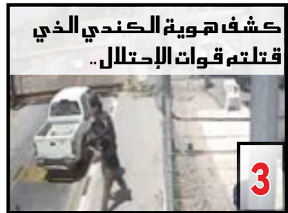
كشف هوية الكندي الذي قتلتم قوات الإحتلال ..