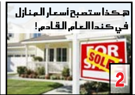
هكذا ستصبح أسعار المنازل في كندا العام القادم!