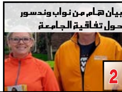
بيان همام من نواب وندسور حول تفاقية الجامعة